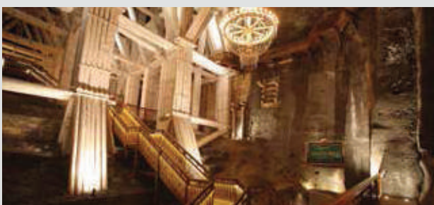
維利奇卡鹽礦, 克拉科夫