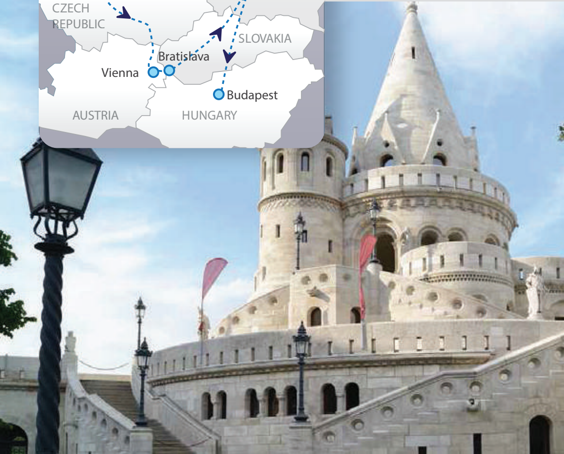
Fisherman Bastion, Budapest